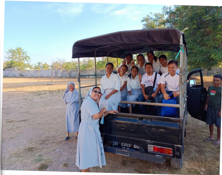
La comunidad de las escolapias, siempre ayudándonos.