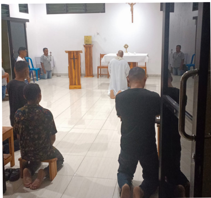
Capilla de la comunidad durante la Exposición del Santísimo.