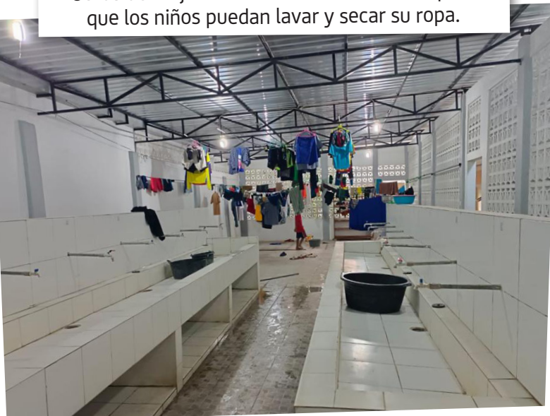
Obras de mejora del asrama: un lavadero para que los niños puedan lavar y secar su ropa.