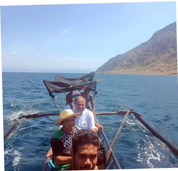
Camino a Dili

no formal en la que participan cada día más de 175 niños. Es una gracia de Dios ver tanta vida y entrega que han generado 10 años de presencia escolapia, y cómo todos, aspirantes, novicios, juniors y demás religiosos se desviven, mu-