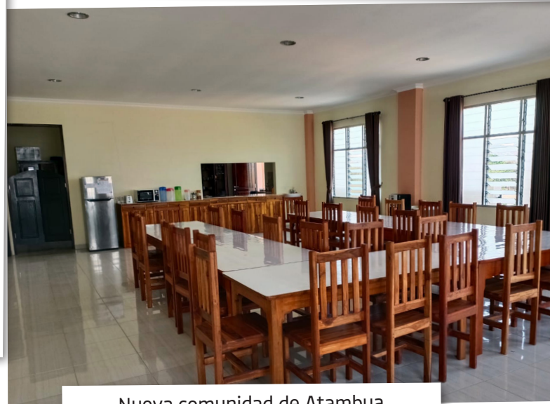
Nueva comunidad de Atambua