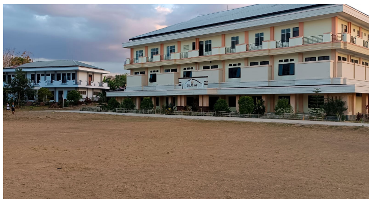
Al fondo el edificio del noviciado y en primer plano la comunidad religiosa y el asrama.

Finalmente, llegamos a nuestra bulliciosa casa de Atambua, y digo bulliciosa porque está llena de gente y, sobre todo, de niños. Por un lado, una comunidad, acogedora a más no poder, formada por cuatro sacerdotes y un profeso solemne, por 6 juniors (3 de ellos estudiando en la ciudad de Kupang), 6 novicios y 10 aspirantes. Por otro lado, una presencia, llena de vida, con más de 100 niños y jóvenes en el Asrama (internado) y con los más de 175 niños que participan en el Learning with Calasanz , una educación