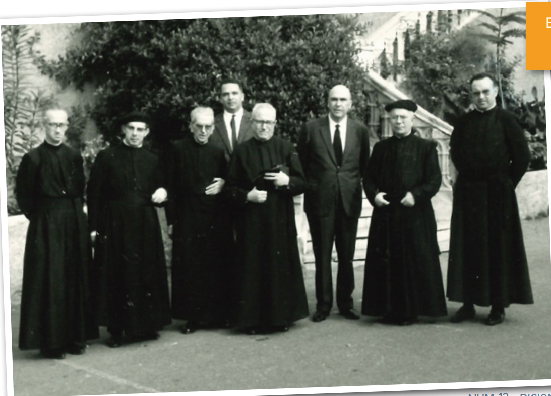
Bodas de Plata del colegio Santa Cruz de Tenerife 1966

Una sección para recuperar fotografías antiguas de nuestros Archivos que testimonian el trabajo y el esfuerzo de todos los que han ayudado a levantar y sostener la obra de Calasanz.