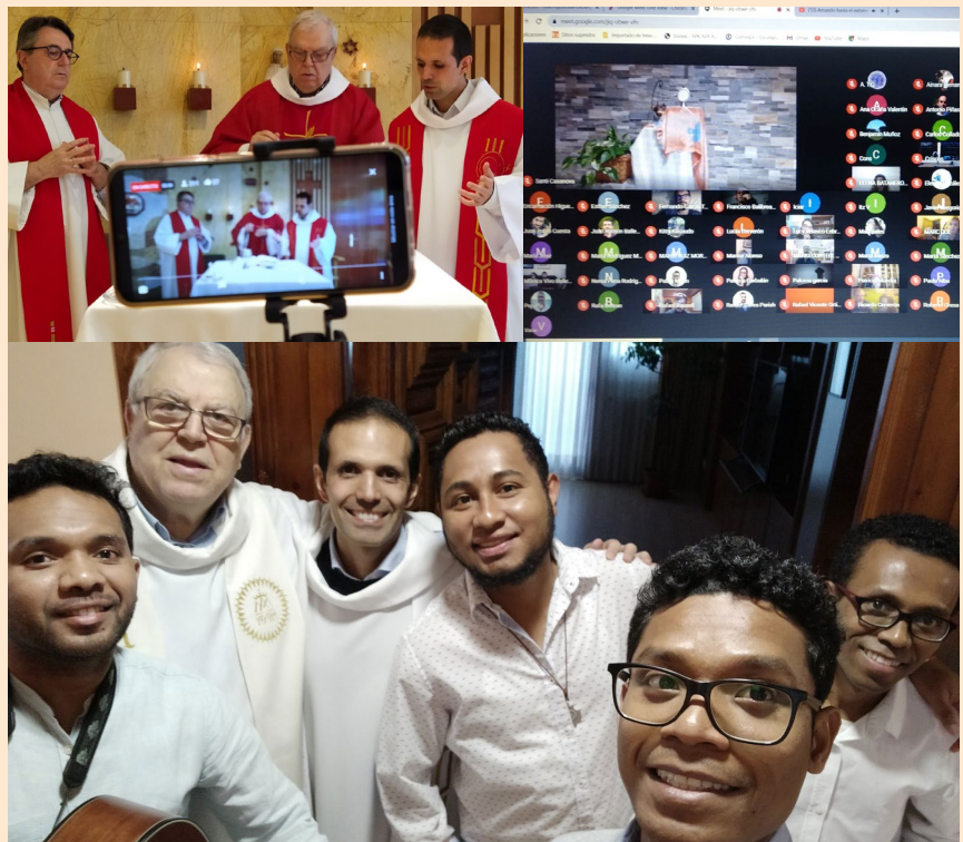
Cada día se organizaba en torno a los oficios retransmitidos desde la comunidad de Aluche. También las oraciones compartidas por la noche congregaban a más de un centenar de personas entorno a la Palabra.

Y así, se planificaron los materiales a ofrecer, unos específicos para las familias a través de vídeos que explicaban de forma amena el sentido del día y ofrecían talleres y experiencias para hacer juntos. Así mismo, una video catequesis y un sencillo documento ayudaba a los adultos a profundizar en el sentido de cada uno de los días de la Pascua, junto a la celebración retransmitida de los oficios, gracias al buen hacer y generosidad de la Comunidad de Aluche. Ya por la noche, una oración compartida a través de videoconferencia ponía la guinda a cada uno de los días. A través de la web de pastoral de la provincia los materiales estaban disponibles cada día para descargar y acceder a ellos. También las redes sociales daban buena cuenta del programa del día y de las celebraciones y modos de conectarse.